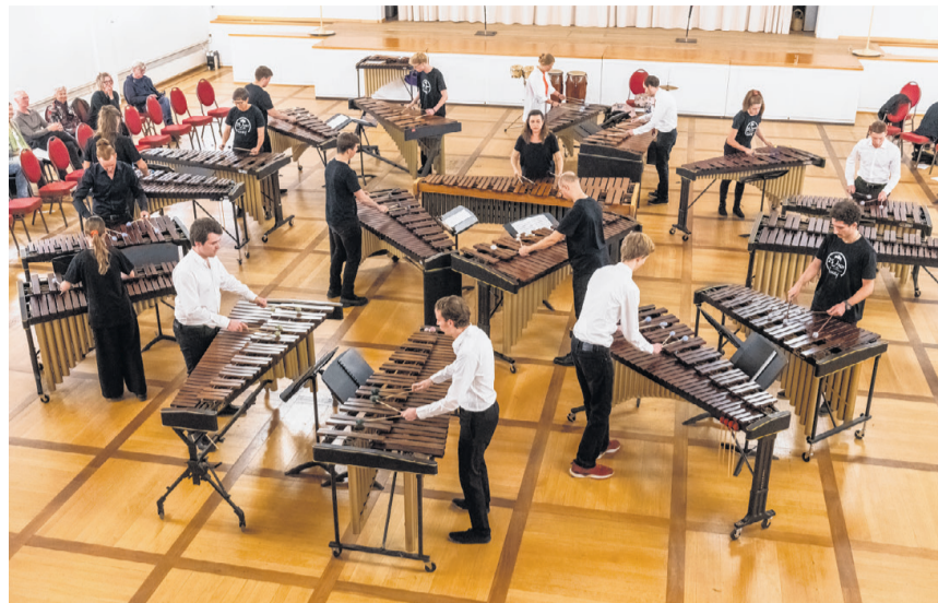
Weltrekord mit 18 Marimbas im Landgasthofsaal.